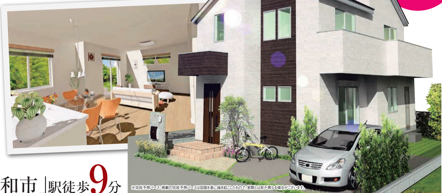
※完成予想パース・掲載の完成予想パースは図面に描き起こしたもので、実際とは若干異なる場合がございます。